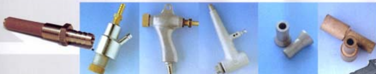
Ugelli prolungati in carburo di tungsteno