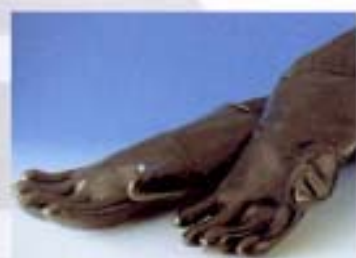
Guanti lunghi in neoprene