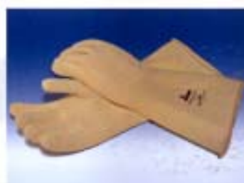
Guanti corti in lattice