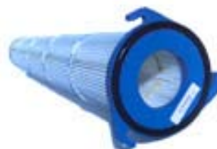
Cartuccia filtrante in poliestere