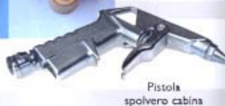
Pistola spolvero cabina

Tutti i particolari di normale usura sono disponibili in pronta consegna e grazie alla convenzione con corrieri espresso vengono spediti in tutta Italia. I nostri ricambi sono universali e pertanto si adattano anche ad altre tipologie di macchine sabbiatrici. Disponiamo di magazzino stoccaggio ricambi ed abrasivi di mq. 1.300.